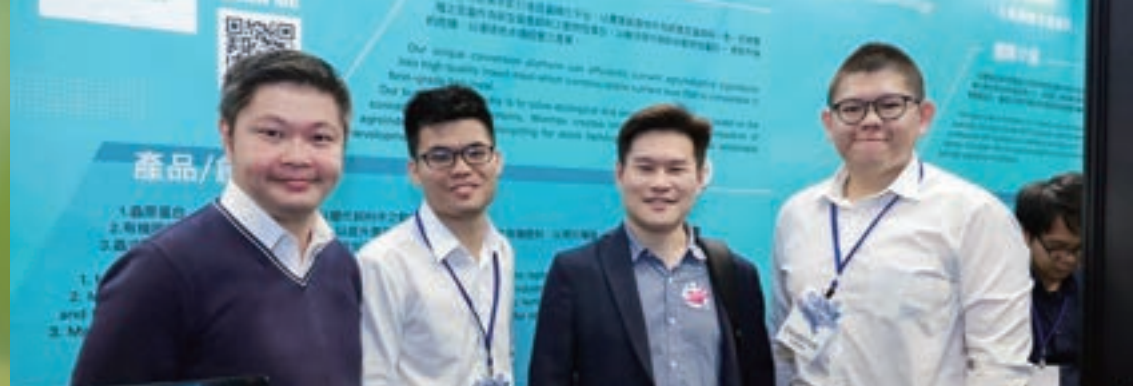
蟲小道大 創辦團隊